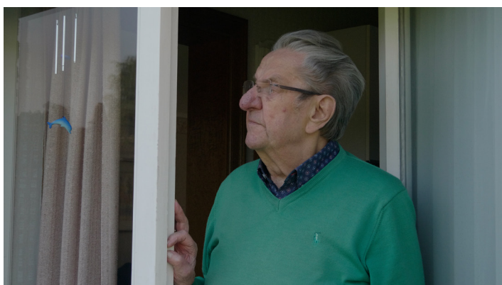
Videostills uit 'Over de schutting'

Nina de Vroome (°1989) is een onafhankelijk filmmaakster. Ze studeerde film aan het KASK / School of Arts in Gent. In 2016 voltooide ze 'A Sea Change', een documentaire over een maritieme kostschool in Oostende. De korte documentaire 'A Dog's Luck' (2018) is een portret van een groep politiehonden tijdens hun training. Haar meest recente film 'Globes' (2021) is een essayistische natuurdocumentaire die de band tussen mens en bij in kaart brengt. Daarnaast geeft ze les bij verschillende educatieve projecten, maakt collages, en gaat samenwerkingen aan als geluidstechnicus en monteur.