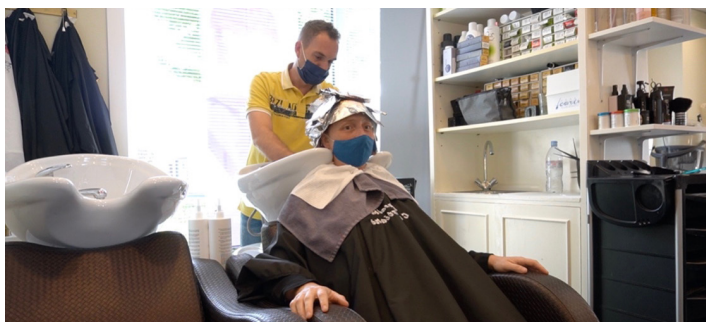
Videostills uit “En van lengte?” © Elien Ronse

Ik ben een witte Belgische hetero vrouw die hoogopgeleid is als beeldend kunstenaar, ik ben deel van non-monogame relaties en officieel leef ik onder de Belgische armoedegrens. Ik engageer me in projecten waar diverse disciplines samenkomen zoals hedendaagse kunsten, sociaal werk, politiek activisme, theoretisch onderzoek,... Daarnaast ben/was ik actief in relationele-collaboratieve projecten en organisaties zoals Manoeuvre, Cultureel Centrum Truck Stop, De Koer, Other Women's Flowers, Para-instituut voor KUNST en precariteit ,... Ik behaalde een MA in Vrije Kunsten in Dutch Art Institute, een Advanced MA in Sint Lucas Antwerpen en een BA in Sociaal Werk.